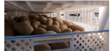
Die ersten Salatblätter recken sich zum Licht ... und die Kartoffeln keimen vor